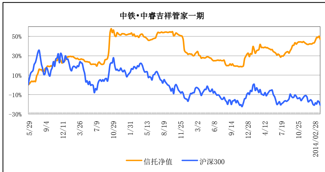
图2：产品成立以来净值表现与大盘（沪深300）对比