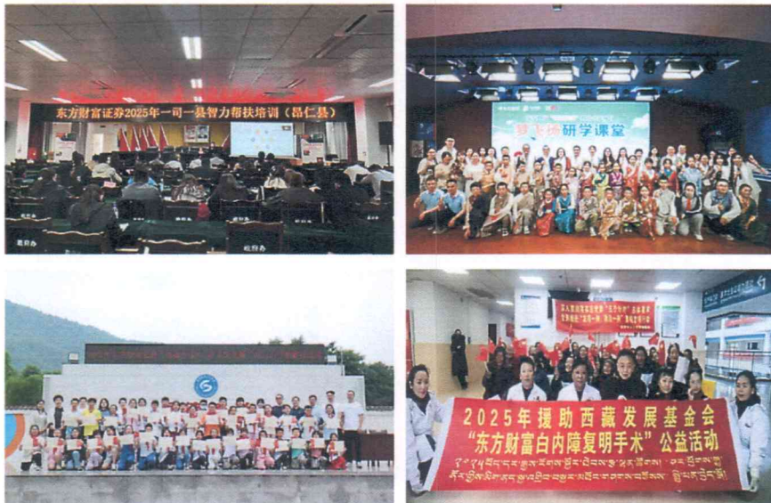
（图片说明：东方财富证券开展智力帮扶培训、东方财富“雏鹰展翅”教育公益项目启动、四川省彭州市龙门山学校爱心慰问、“东方财富慈善光明行”项目）

受灾县的 30 余名师生走进上海开展沪藏文化交流；支持西藏亚东县实验小学师生走出高原，走进成都开展“去远方”研学，拓展学生课堂边界；东方财富电影美育项目开展线上“美育课堂”40 课时，支持首批 36 名西藏师生来沪开展“梦飞扬”研学，以美育促进民族间交往、交流、交融，进一步助力沪藏教育联动和边疆人才建设。