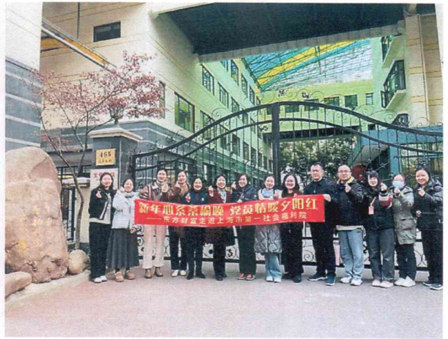
（图片说明：公司党员志愿者赴上海市第一社会福利院开展慰问活动）

创新主题党日活动，坚持理想信念践行不辍。公司不断夯实党员政治理论根基，强化理论武装。全面推进“一支部、一品牌、一特色”创建活动，不断丰富品牌内涵，打造独具东财特色的党建名片。深化党的理论学习，邀请中国浦东干部学院专家为公司党员及管理干部开展党的二十届四中全会精神现场授课。以党建带工建，组织开展“东财享悦读·巳年品墨韵”主题阅读活动，设立党史专题，激发广大员工阅读党史的热情。7—9月公司党委、工会在全司范围联合组织开展“党旗引领 聚力同行—2025红色文化探索启征程”活动，聚焦党员、群众职工需求，组织赴嘉兴