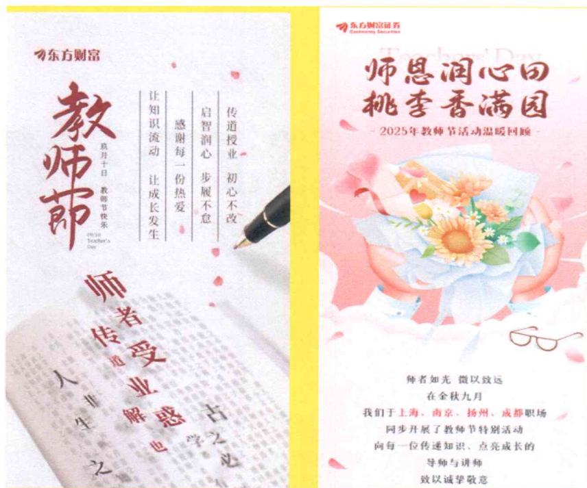
(图片说明：“感谢师恩 崇尚专业”的文化氛围在公司形成传统)

一位员工成为数字疆土的忠诚卫士；它是以创新为动力的活力文化，激励奇思妙想并为之提供绽放的舞台；它是以技术为信仰的极致文化，追求代码背后的匠心与温情；它更是以人文为底蕴的包容文化，尊重多元个性、倡导展现自我，营造平等开放的生态氛围，共同谱写了一曲关于“安全、创新、技术、人文”的数字化文化新篇章。