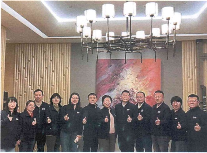
（图片说明：“学全国两会精神 话高质量发展”联合主题党日活动）