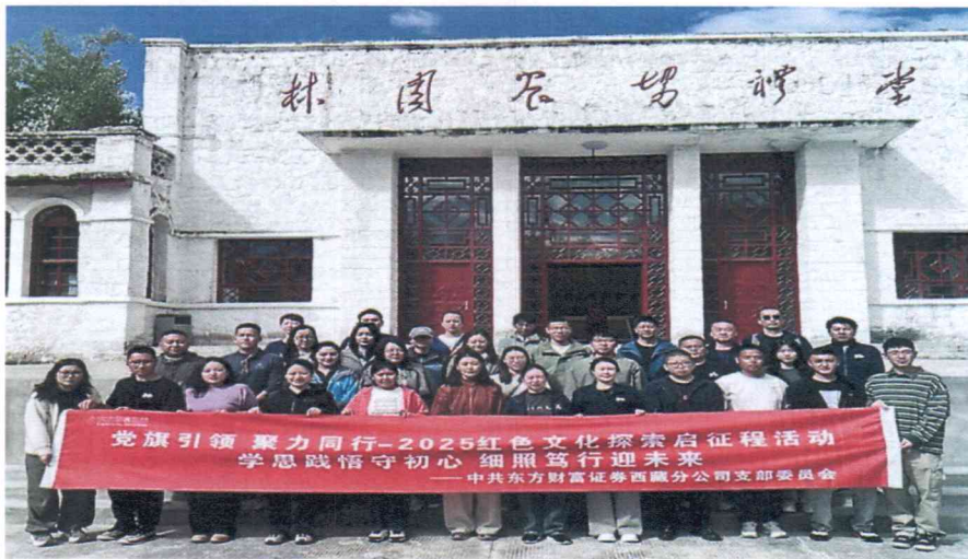
（图片说明：2025 年 7 月，东方财富证券西藏分公司党支部赴林周农场开展党建联学共建活动）

会责任列入公司发展战略，增加公益力量投入，更好地践行社会责任，身体力行兴边富民。先后与西藏 6 个县结对帮扶，发起东方财富慈善光明行、拉萨南北山国土绿化、雏鹰展翅教育等公益项目，架起沪藏交流桥梁。