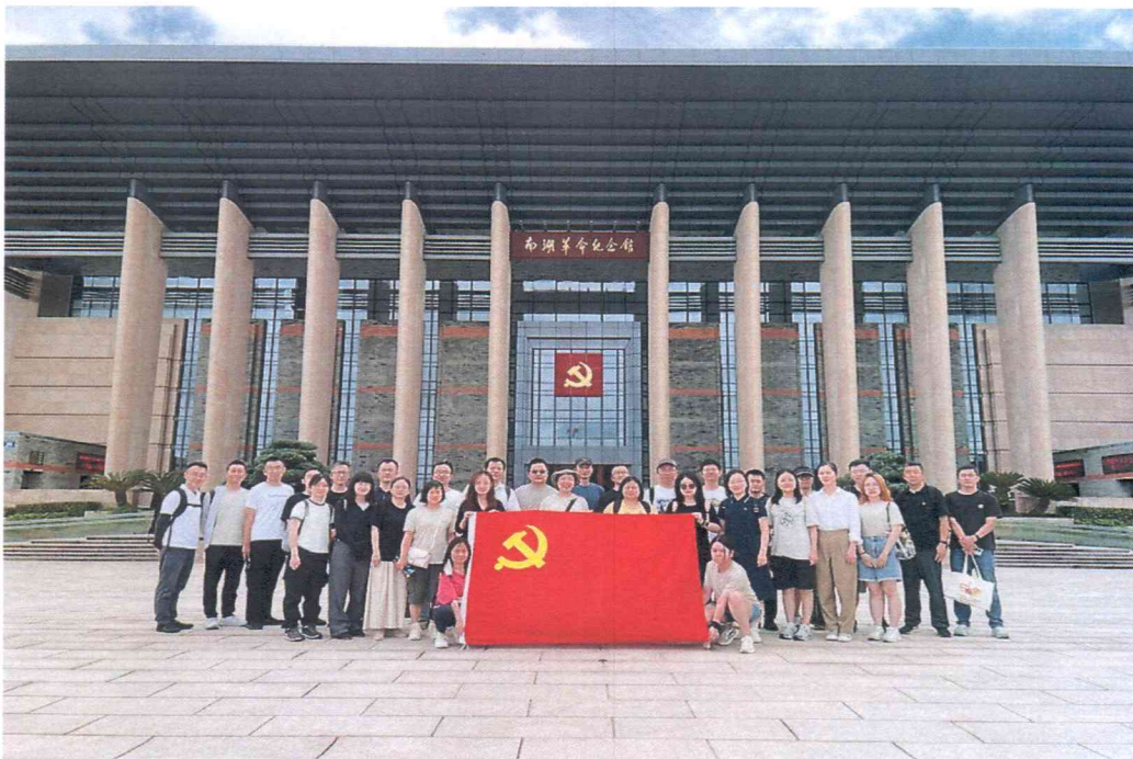
（图片说明：2025年7月，东方财富证券党委组织党员赴嘉兴南湖革命纪念馆开展主题党日活动）

坚持抓基层打基础，持续推动党支部标准化规范化建设。坚持落实“三会一课”和主题党日等制度，严格执行组织生活会、民主评议党员等要求，党委成员带头参加双重组织生活。创新党建工作载体，全面推进“一支部一品牌”建设，开展“党旗引领·聚力同行——红色探索启征程”“党史微电影”“红色文艺汇演”等特色主题党日活动。前置审议公司年度企业文化建设方案，将党史学习教育融入“东财享悦读”群众性读书活动，将党建要求融入企业文化建设。持续开展“两岗一区”先锋实践活动，规范落实党内表彰激励。