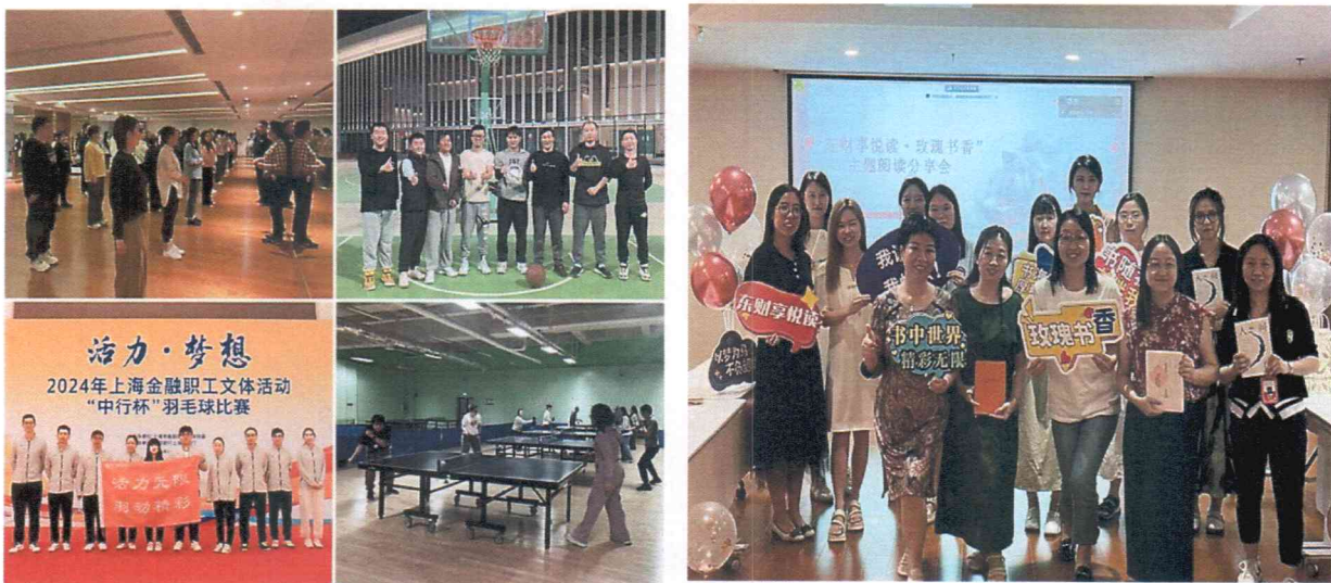
（图片说明：东方财富证券社团和兴趣小组活动）

落地的项目，营造出温馨和谐的“东财一家人”氛围，增强了员工对公司的归属感和幸福感，助力文化理念落地生根。报告期内，公司组织节日主题活动、团建活动、读书会、健康跑、“感谢师恩 崇尚专业”教师节活动等文化活动；围绕员工健康安全，组织开展急救知识培训，通过急救流程讲解、实操演练和知识分享，帮助员工提升应急处置和自救互救能力；持续推进职工兴趣小组建设，不断丰富活动内容，拓展活动覆盖面，打造多层次、多样化的文体活动平台，鼓励员工在积极参与中强健体魄、陶冶情操、增进交流。此外，积极组织职工参加上海市金融系统开展的“百年薪火铸荣光 金融报国颂新篇”演讲比赛，通过以赛促学、以讲传情，充分展现员工昂扬向上的精神风貌和立足岗位、奋发有为的责任担当。