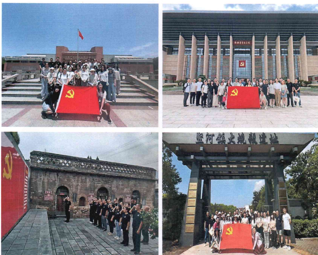
(图片说明：东方财富证券“党旗引领 聚力同行—2025 红色文化探索启征程”系列活动)

南湖革命纪念馆、香山革命纪念馆、东江纵队纪念馆、延安革命纪念馆等革命教育基地共计开展 14 次内容丰富、形式多样、特色鲜明的系列主题活动，有效打破部门、分支壁垒，促进党员思想交流，有效提升各党支部的凝聚力和向心力。