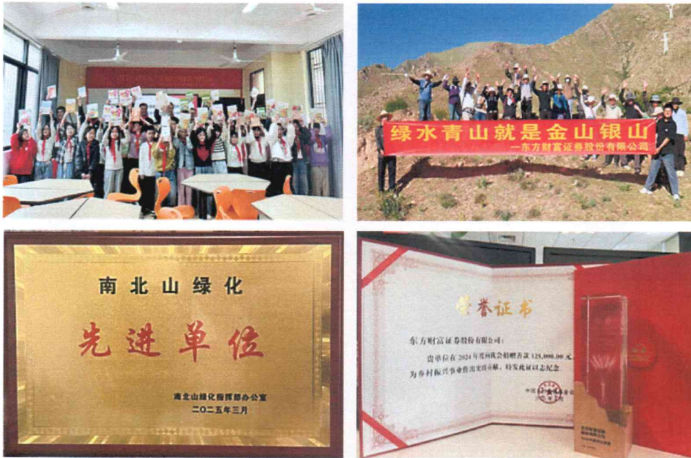
（图片说明：广东岱头小学图书捐赠活动、拉萨南北山项目造林人员合影 荣获拉萨南北山绿化“先进单位”“乡村振兴突出贡献”荣誉）

助力国土绿化。积极响应西藏自治区政府关于拉萨南北山绿化号召，完成 2200 余亩绿化荒地的苗木栽植，助力打造秀美高原。2025 年，公司持续推进生态林养护工作并完成政府部门初步验收，造林成活率达 96%，荣获“南北山绿化先进单位”。该项目带动周边农牧民就业增收，持续改善区域生态环境，实现生态效益与社会效益协同发展。